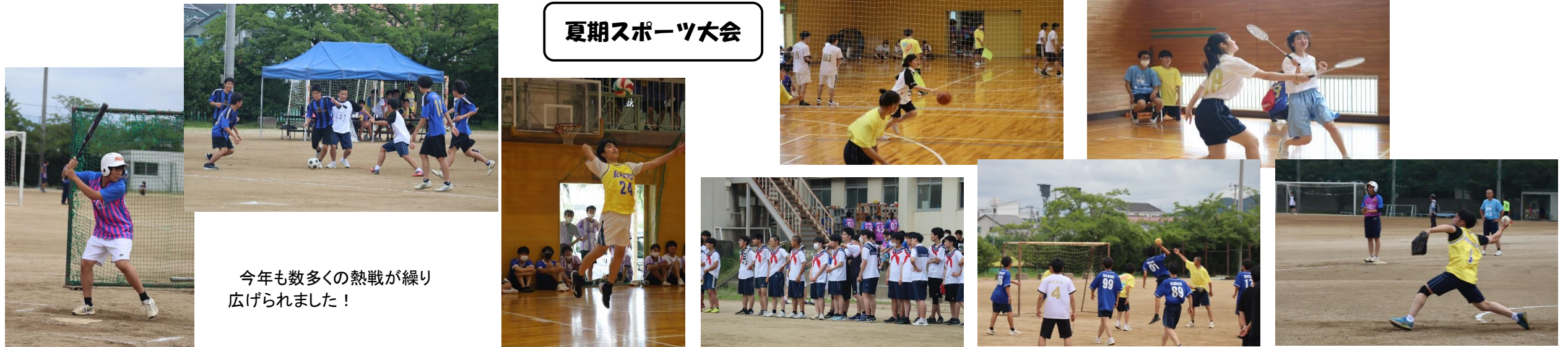
今年も数多くの熱戦が繰り広げられました！