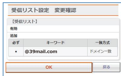
画面イメージ (実際の画面とは異なります)